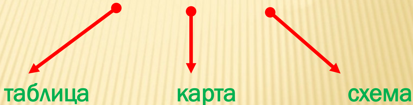
СХЕМА ОРИЕНТИРОВОЧНОЙ ОСНОВЫ ДЕЯТЕЛЬНОСТИ