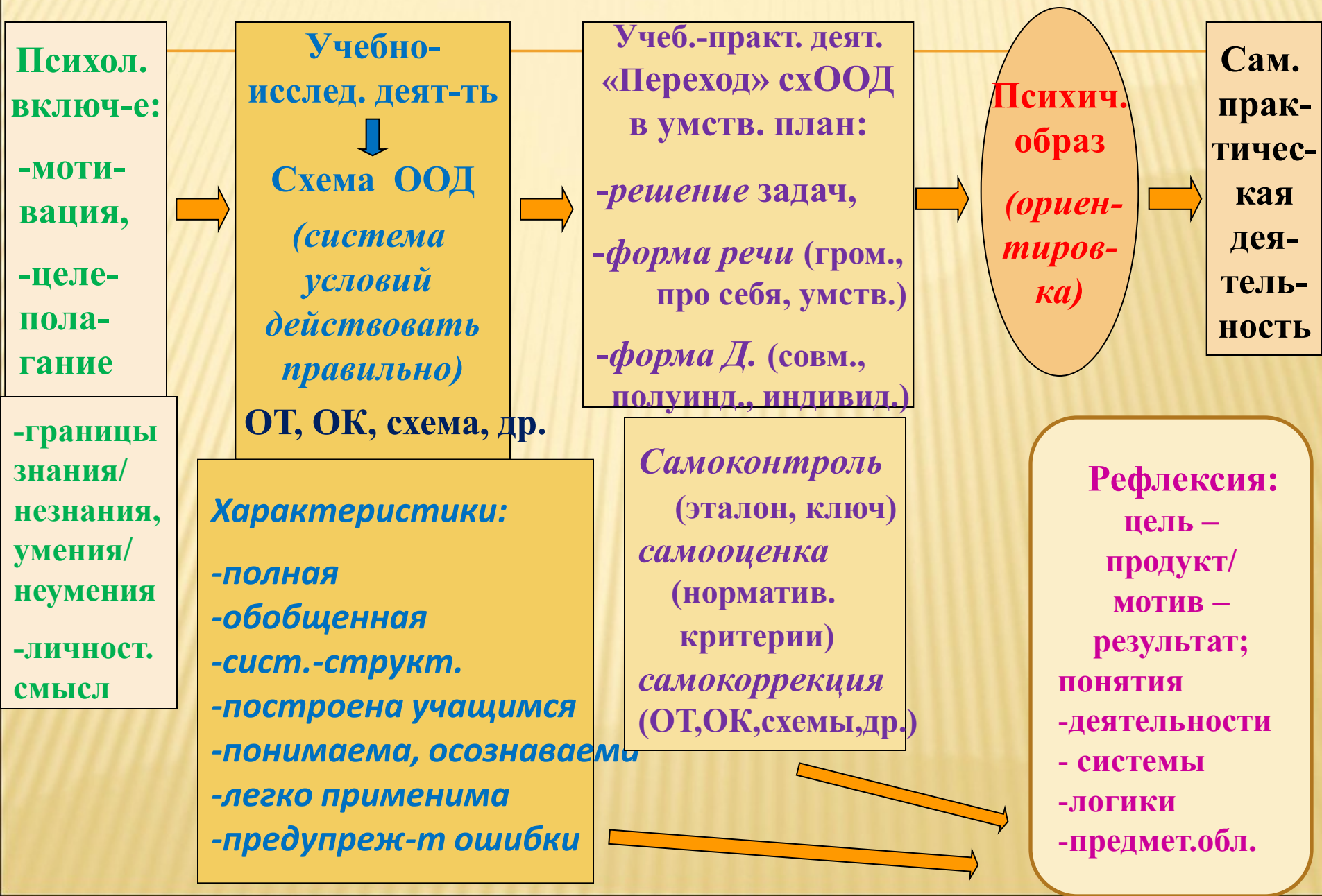
Схема «МЕТОДОЛОГИЯ ПЕДАГОГИЧЕСКОЙ ДЕЯТЕЛЬНОСТИ»